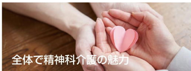
全体で精神科介護の魅力